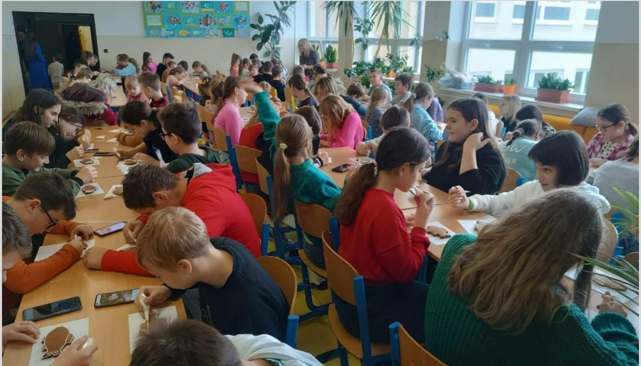
Záujem o zdedenie bol obrovský...