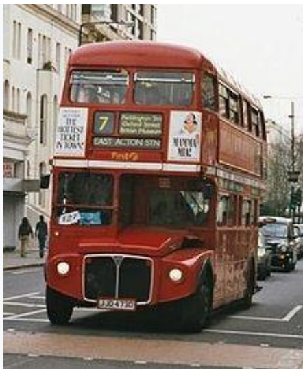
Známy dvojposchodový autobus (doubledecker) v Londýne

Autobus je motorový dvojstopý dopravný prostriedok určený na prevoz minimálne deviatich osôb, vrátane miesta pre vodiča. Najznámejším dodávateľom autobusov na Slovensko je český podnik Karosa Vysoké Mýto (v súčasnosti už patriaci firme Iveco), najčastejším autobusom na našich cestách boli autobusy Karosa radu 700 z rokov 1981 – 1995. Vo väčších mestách bol (predovšetkým v rámci MHD) pomerne častý i maďarský Ikarus, najmä typ Ikarus 280. V súčasnosti na našich cestách jazdia najčastejšie autobusy značiek Iveco Irisbus, SOR ale aj autobusy od slovenského výrobcu Novoplan resp. Troliga Bus vyrábané v Levoči.