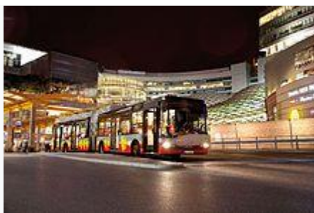
Mestský nízkopodlažný autobus "Solaris" 18 Hybrid Allison vo Varšave

Autobusy sa podľa účelu použitia rozdeľujú na: