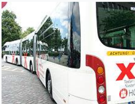
Trojčlánkový (dvojkĺbový) mestský autobus Van Hool AGG 300, dĺžka 24,8 metra