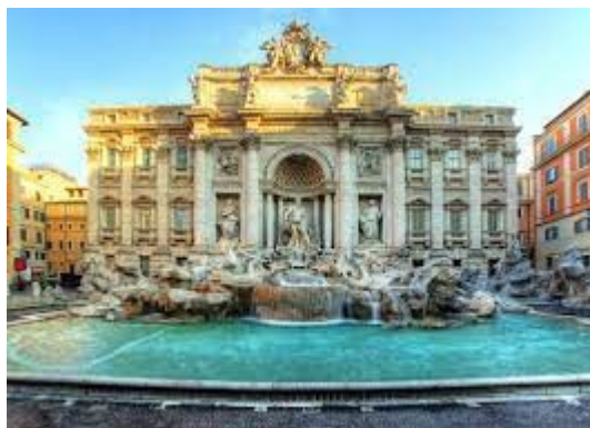
Fontanna Di Trevi