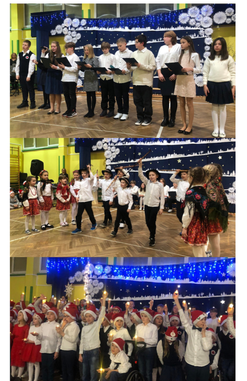
Fot 1, 2, 3

Na wystawę złożyły się archiwalne zdjęcia, materiały z przedwojennej prasy, afisze, a także opowieści o przedwojennych mieszkankach i mieszkańcach Falenicy ocalałych z Zagłady, opracowane na podstawie książki „Sefer Falenic”. O treści przekazu można dyskutować ze względu na kontrowersje w ocenie i interpretacji przedwojennych i wojennych relacji polsko-żydowskich.